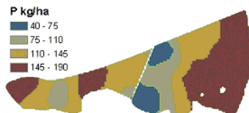
figur 1. Mellan 2000-2004 tillfördes med stallgödsel mellan 27 och 189 kg P/ha.

En markkartering gjordes hösten 1999 och låg till grund för stallgödselgivorna. En ny markkartering utfördes hösten 2004. På de aktuella fälten var grödorna under åren vall, höstvet och havre med vallinsådd. Både fastgödsel och flytgödsel spreds under projektet. Vid flytgödselspridningen användes en släpslangspredare med flödesmätare som styrdes av en handdator med GPS. I handdatorn användes programvaran Farm Site Mate för att styra gödselmängden utifrån markkarteringsvärdena (se figur 1). Vid spridning av fastgödsel användes en karta och manuell styrning av givan. Eftersom varierad stallgödselgiva också för med sig varierade kvävegiva så korrigerades N-givan varje år med N28 efter en omvänd stallgödselkarta.